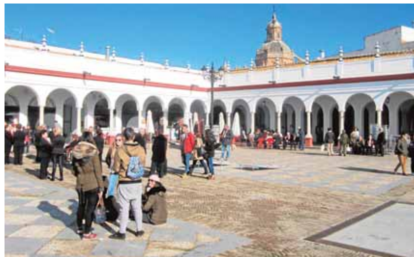
El mercado de Carmona ocupa un edificio de interés patrimonial

Previamente a este proceso de adjudicaciones el Ayuntamiento ha realizado diversas obras de mejora y adecuación en el inmueble con una inversión de unos 110.000 euros.