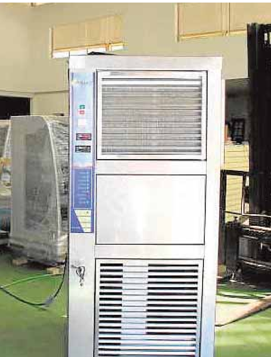
Altecfrió, antes de empaquetar la máquina para su envío

que se enfrentan a los últimos exámenes la preparación de los mismos. El último fin de semana de mayo y los del mes de junio abrirá los fines de semana. En horario de mañana abrirá de 9 a 14 horas y en el de tarde de 16 a 23 horas.