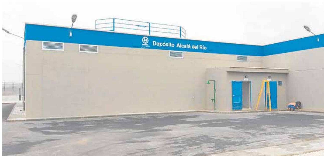
El depósito de agua potable cuenta con dos tanques que garantizan entre tres y cuatro días de agua para Alcalá

Dos tanques con sistemas de control vía satélite almacenarán hasta ocho millones de litros de agua