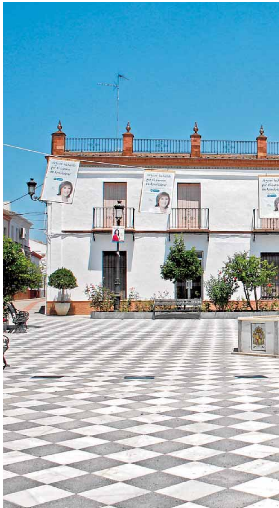
Estado de la plaza del Ayuntamiento de la localidad de Aznalcázar, totalmente des-

Carretera arriba, en Sanlúcar la Mayor, la situación es parecida. A la entrada del pueblo se encuentra uno de los supermercados, donde trabaja Al-