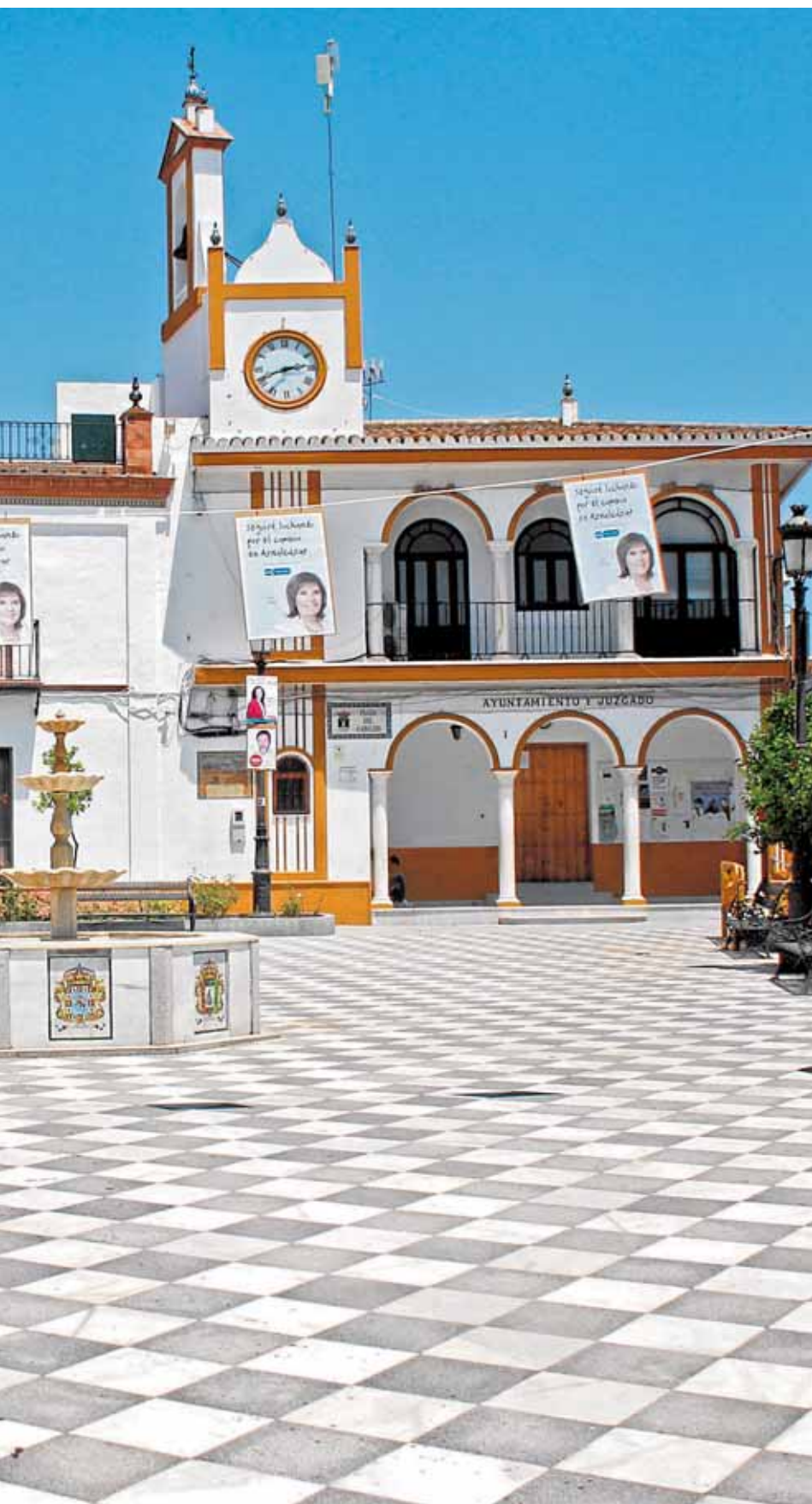
abierta, al mediodía del pasado sábado

vehículo anterior, el Consistorio ha adquirido un Citroen C4 «aircross» que refuerza la dotación integrada por dos coches y dos motos. Es un vehículo todoterreno que permitirá circular a los agentes fácilmente por los caminos del municipio.