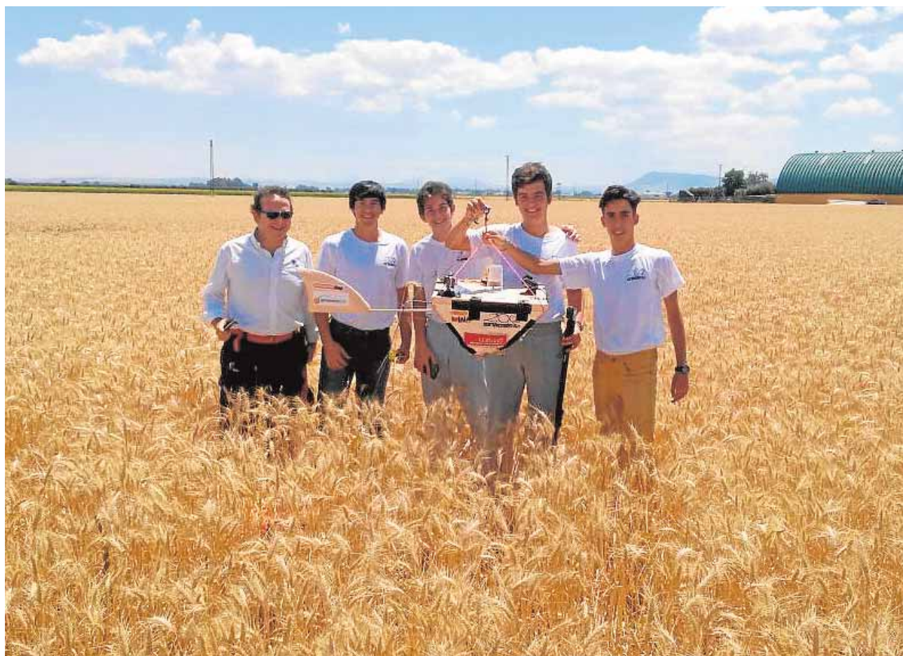
Los alumnos del centro educativo utrerano recuperando la cápsula que alcanzó la estratosfera

zado la delegación municipal de Educación y que también se han impartido a alumnos de Infantil, Primaria y Secundaria. Durante cinco meses, una treintena de vecinos en paro han reforzado sus conocimientos sobre este idioma. A.H