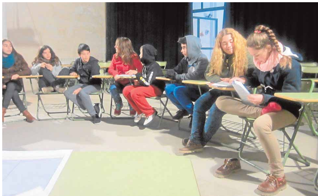
Jóvenes parlamentarios de Cazalla de la Sierra durante una sesión de este original programa